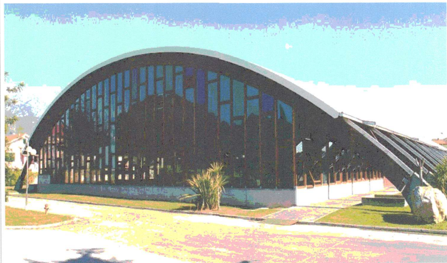
TAV.2- STATO ATTUALE

PROGETTO DEFINITIVO-ESECUTIVO PER L'ABBATTIMENTO BARRIERE ARCHITETTONICHE NEL PALAZZETTO DELLO SPORT SERVIZI IGIENICI INGRESSO PIANO TERRA