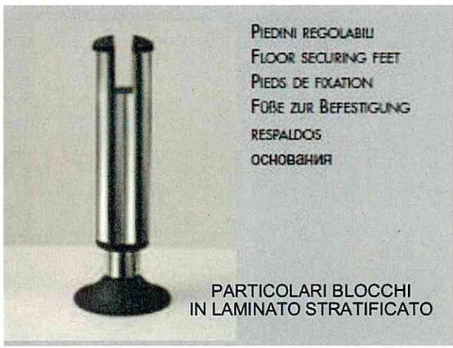
PARTICOLARI BLOCCHI IN LAMINATO STRATIFICATO