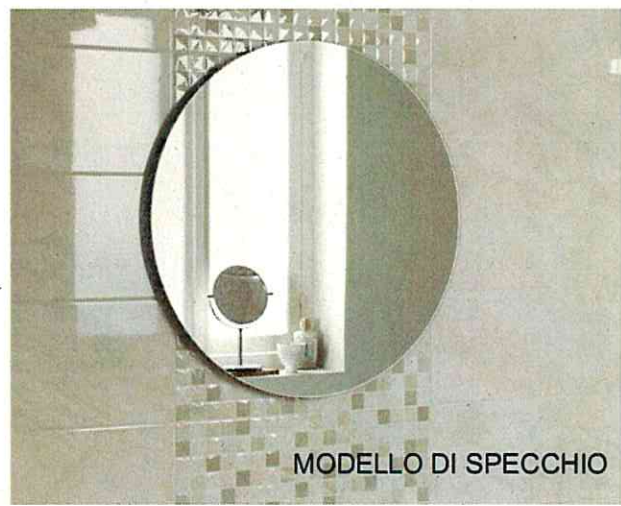
MODELLO DI SPECCHIO