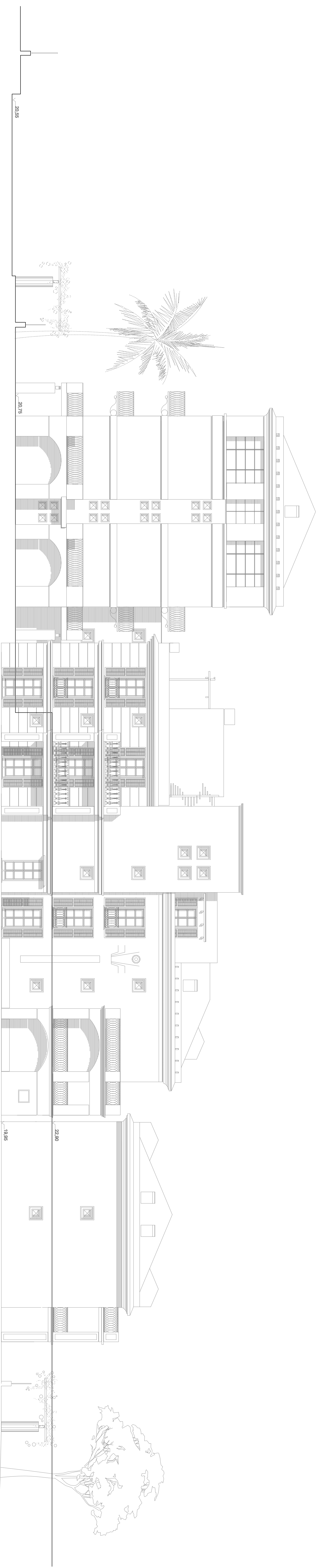
Prospetto Nord - 1/100 Stato di Progetto