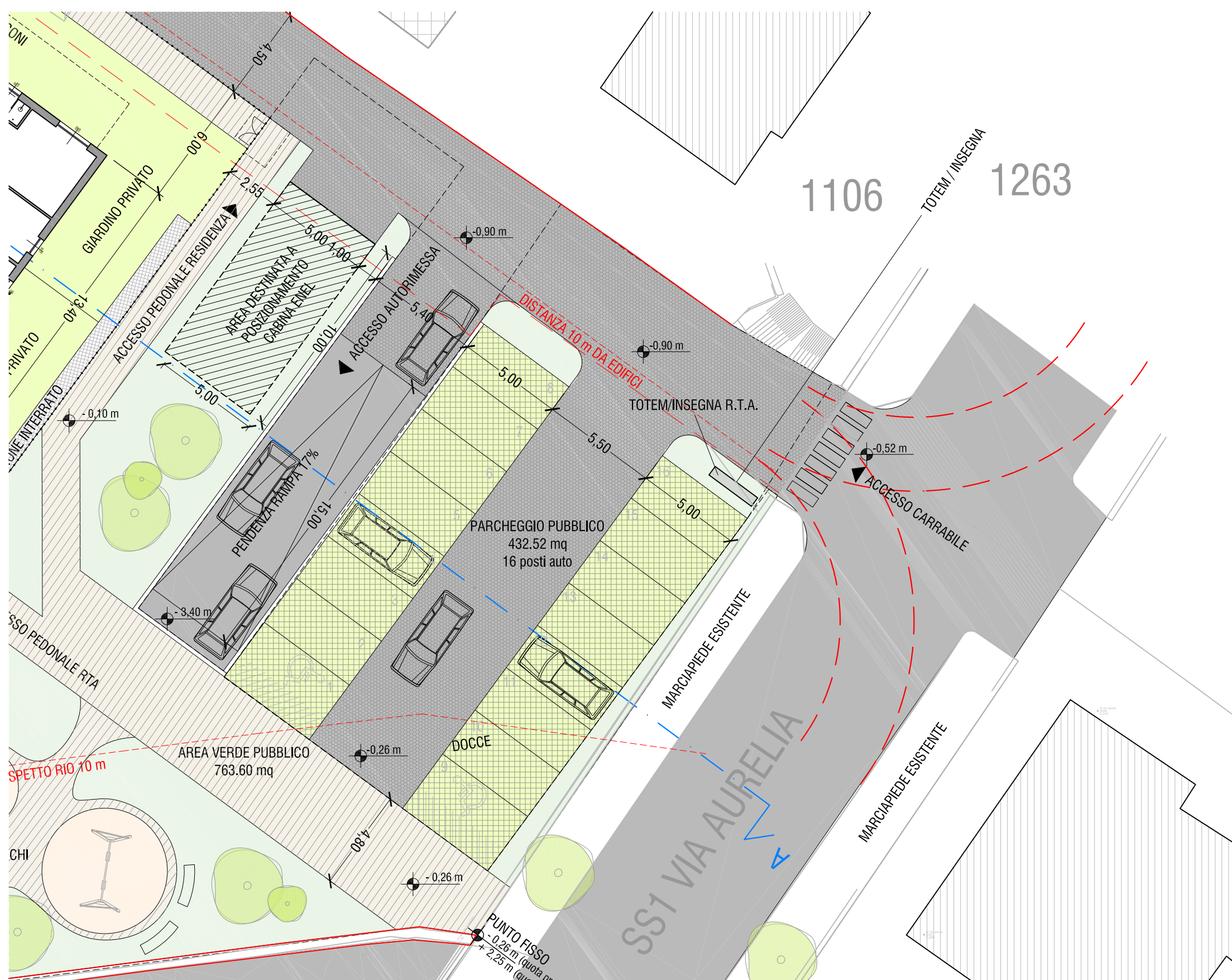
PARCHEGGIO PUBBLICO ESTERNO