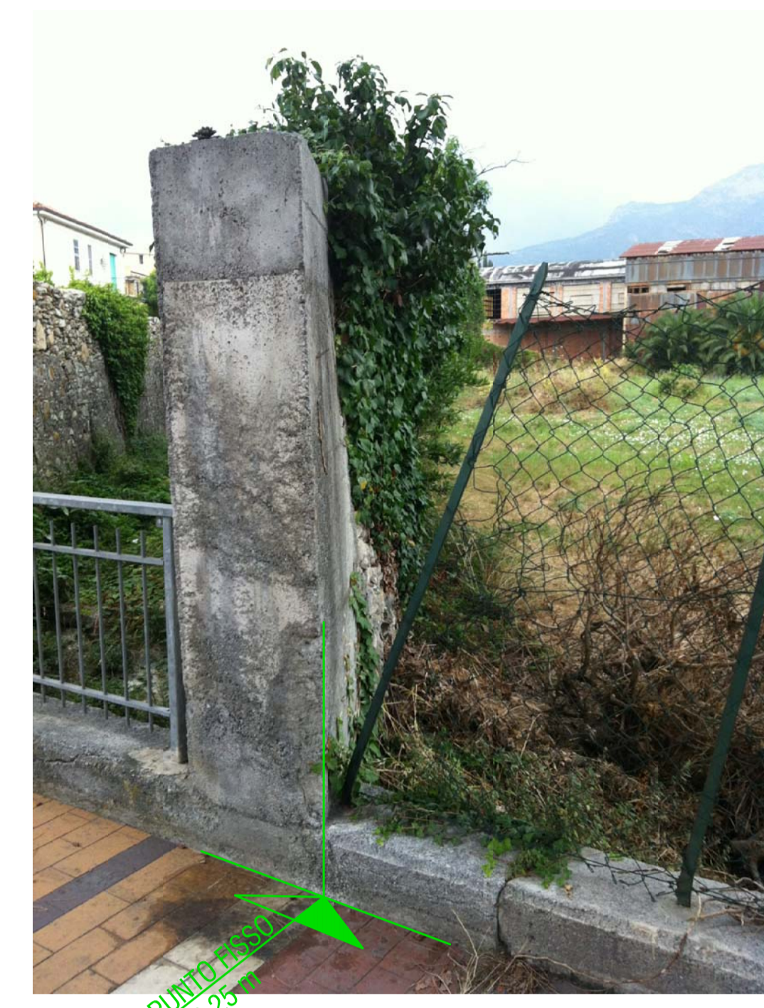
RILIEVO FOTOGRAFICO IDENTIFICAZIONE PUNTO FISSO