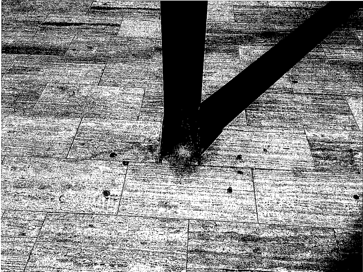
FOTO N. 9 Particolare del degrado / corrosione della base delle colonne HEB160