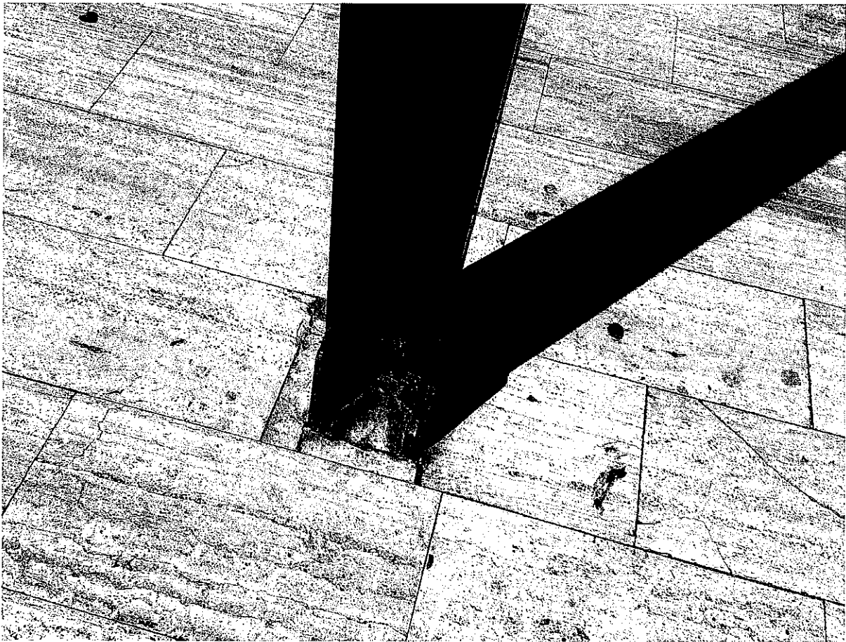
FOTO N. 10 Particolare del degrado / corrosione della base delle colonne HEB160