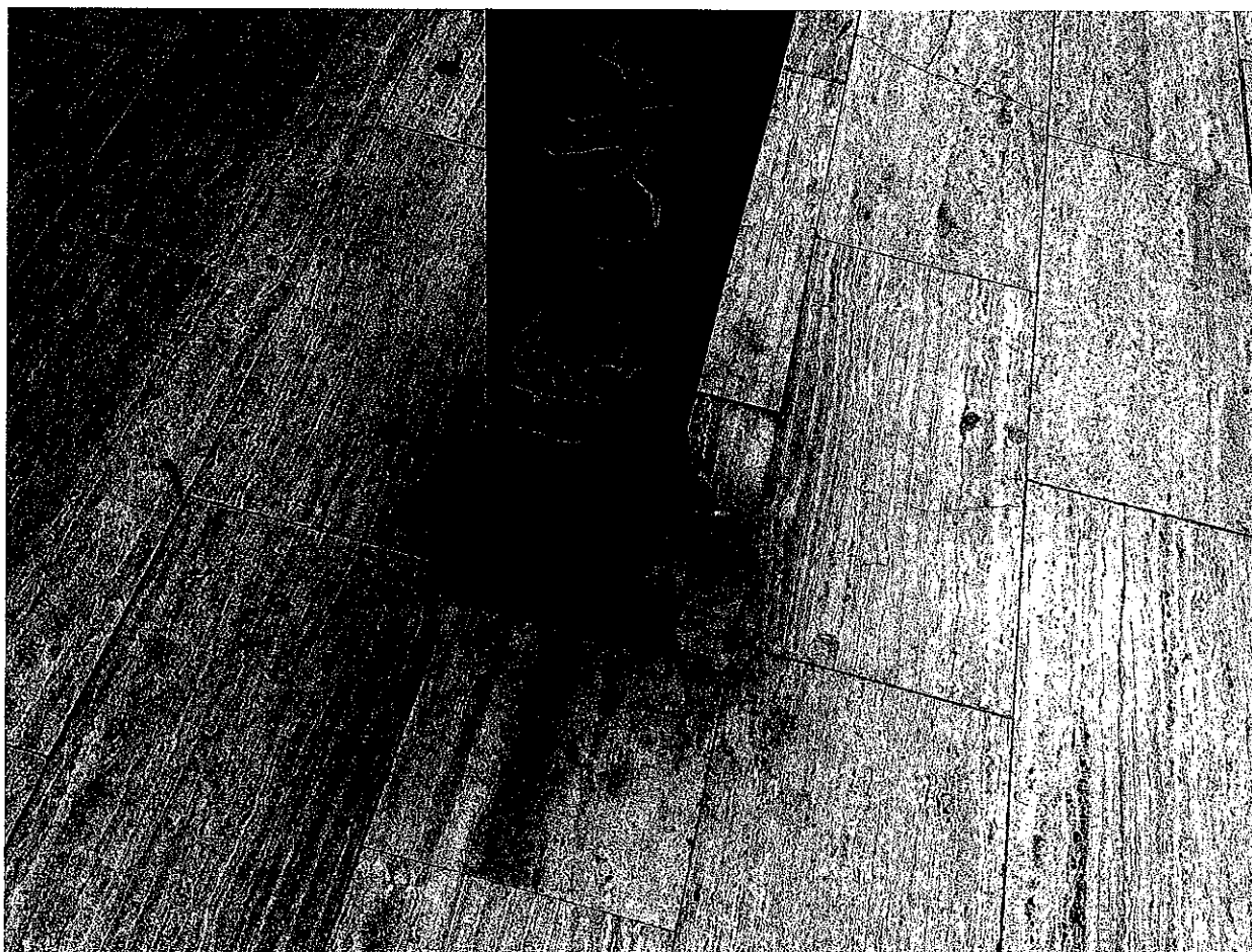
FOTO N. 12 Particolare del degrado / corrosione della base delle colonne HEB160