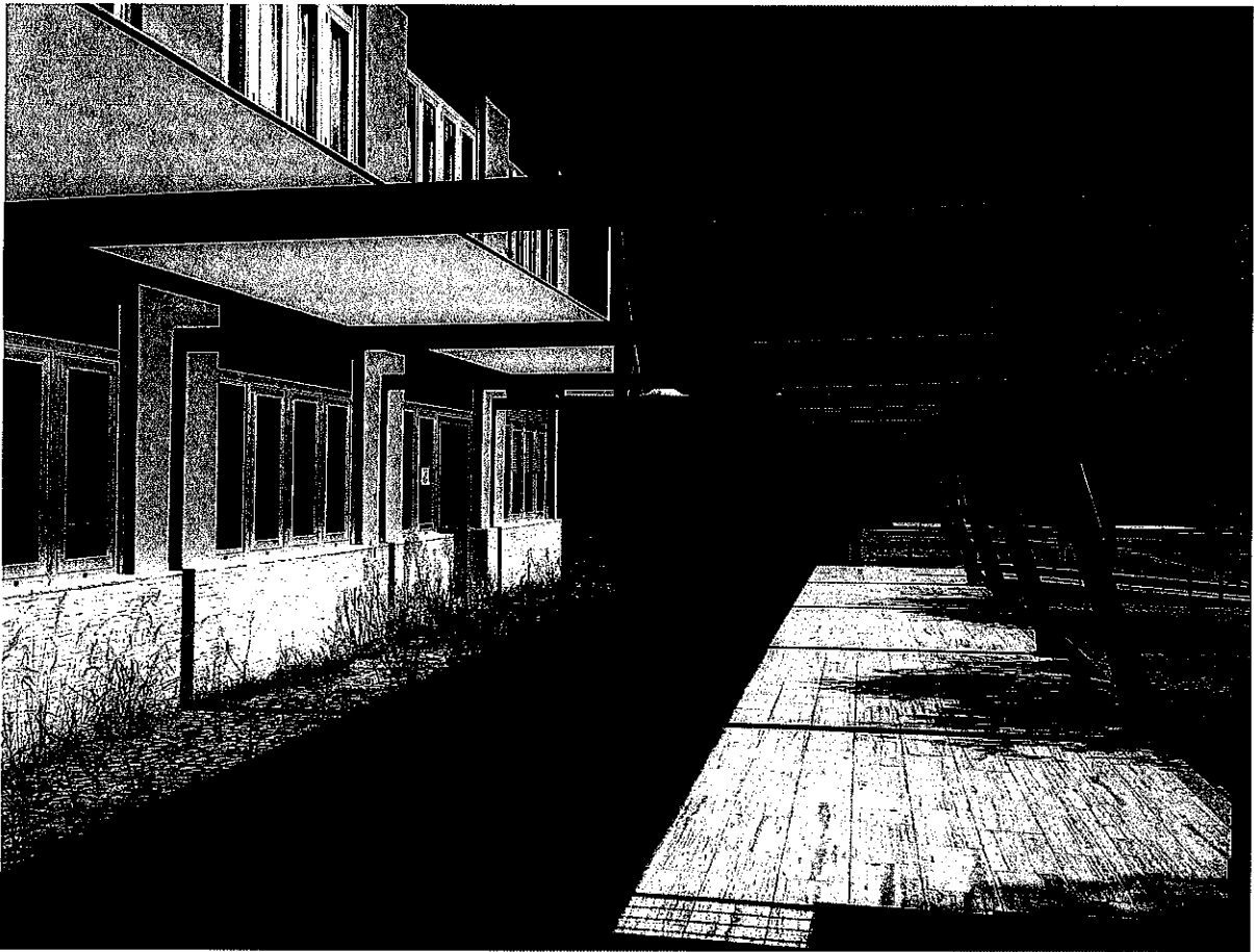
FOTO N.1 Vista della pensiline interne al cortile dell'istituto (lato nord)