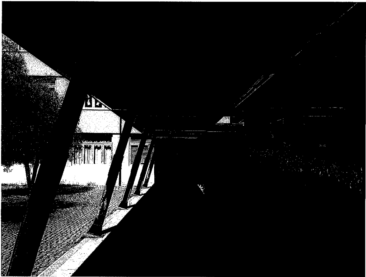
FOTO N.3 Vista della pensiline interne al cortile dell'istituto (lato est)