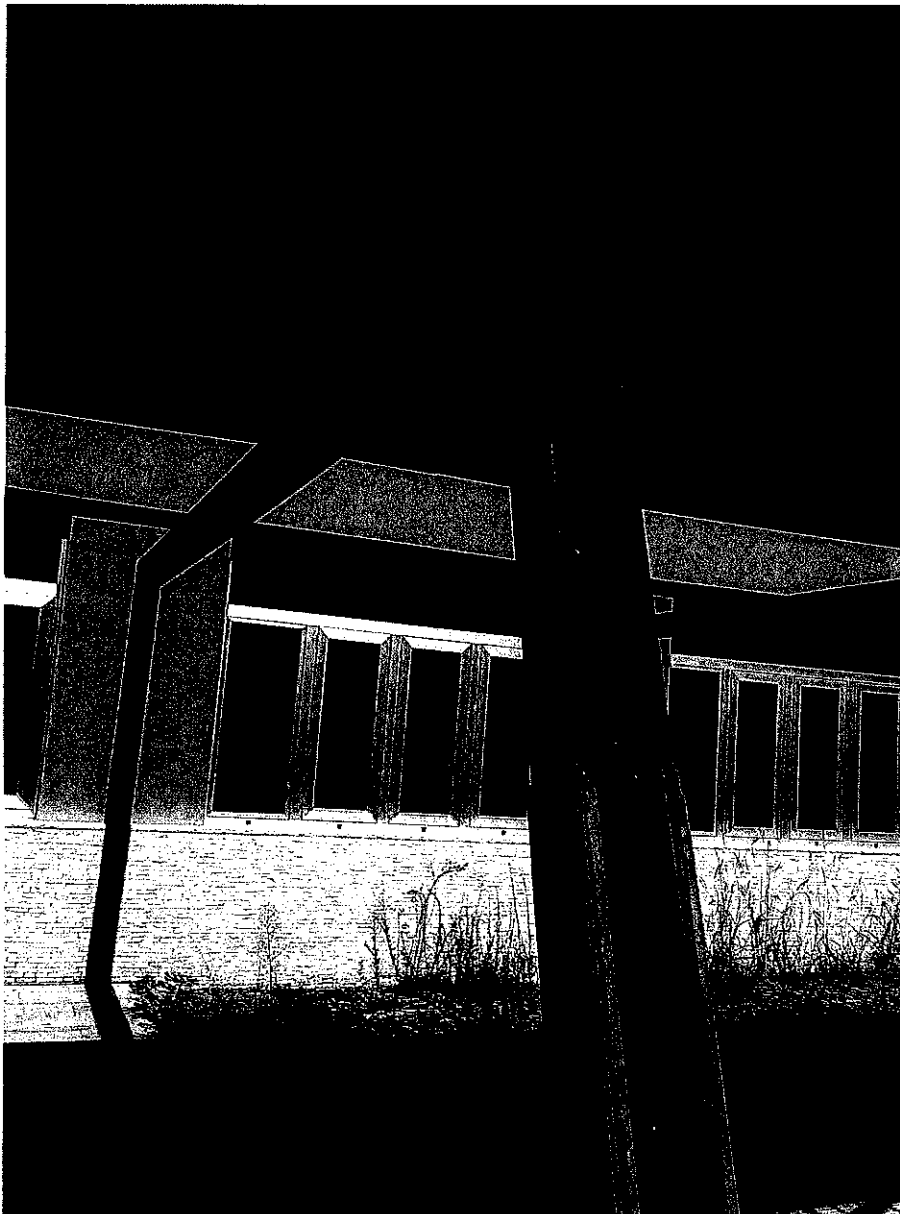
FOTO N.7 Particolare della struttura metallica di sostegno