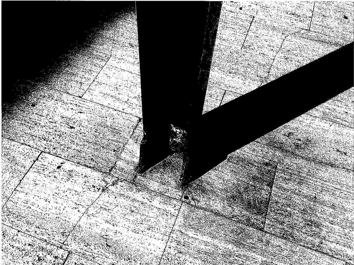
FOTO N. 11 Particolare del degrado / corrosione della base delle colonne HEB160