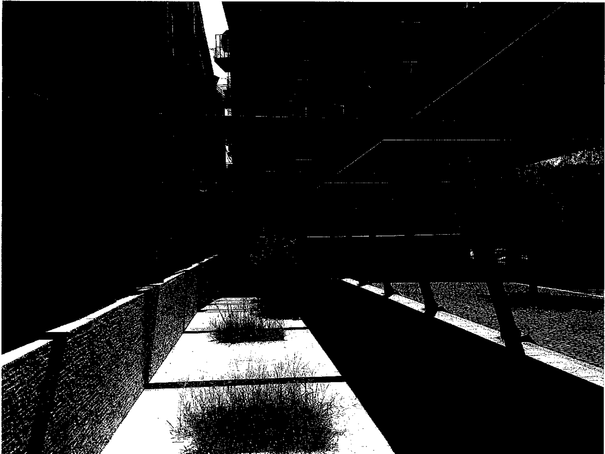
FOTO N.2 Vista della pensiline interne al cortile dell'istituto (lato est)