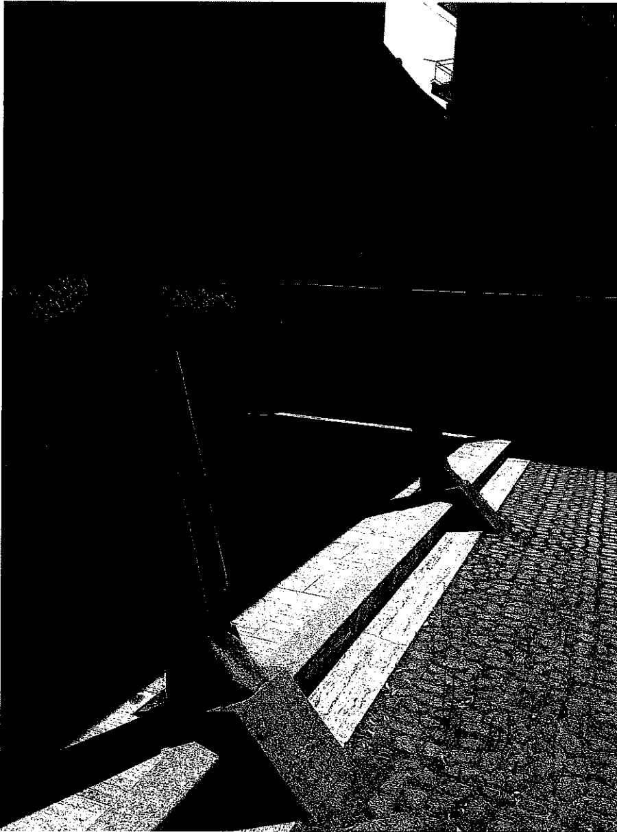
FOTO N.5 Particolare della pensilina interna al cortile dell'istituto (lato est)