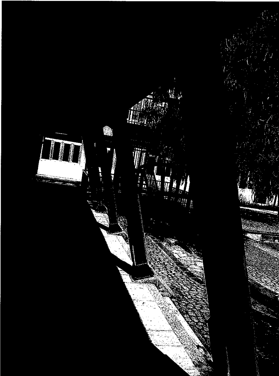
FOTO N.6 Particolare della pensilina interna al cortile dell'istituto (lato ovest)