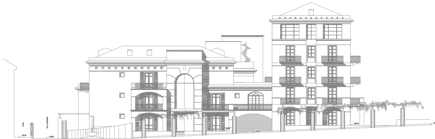
Prospetto Est - 1/100 Stato di Progetto