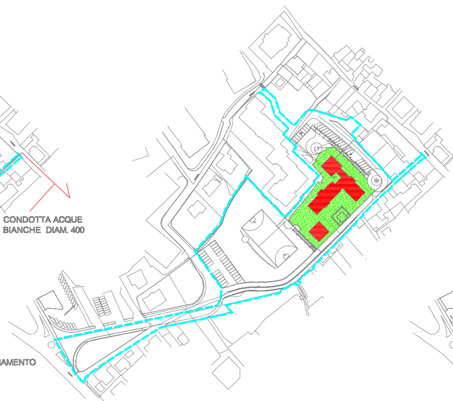
RESIDENZE E VERDE PRIVATO