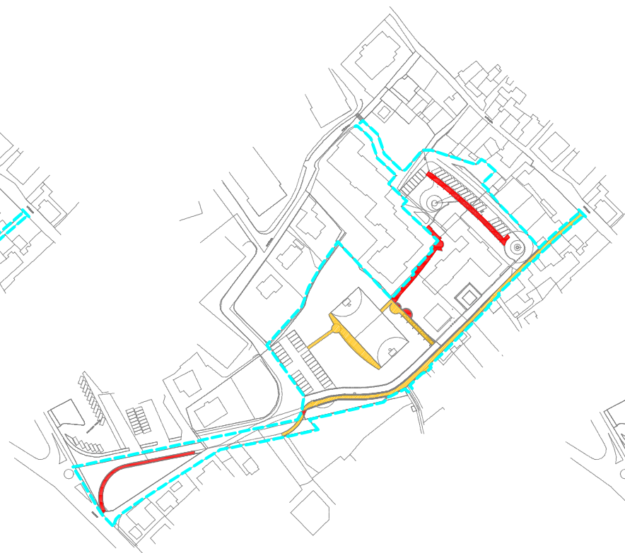
MARCIAPIEDI E PERCORSI PEDONALI