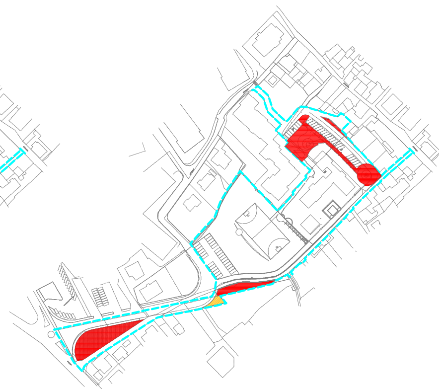
VERDE PUBBLICO - AREE ATTREZZATE